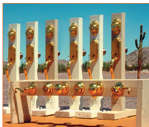
Befestigung von Spezialteilen, Direktbewitterung