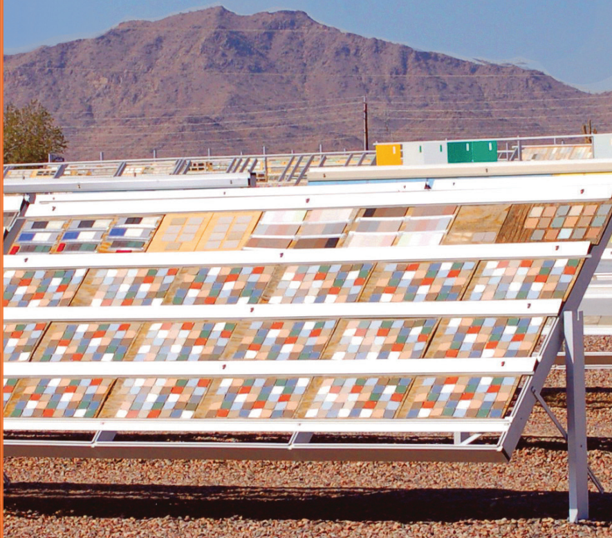
Standardmäßige Direktbewitterung im 45°-Winkel