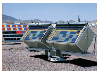
Bewitterung in AIM-Box