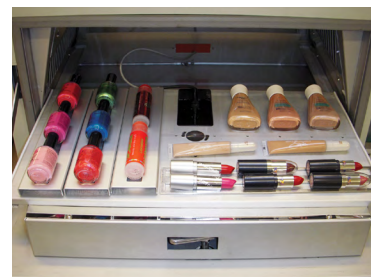
Q-SUN 试验箱扁平的样品托盘和多种安装选项能使瓶子和其他形状各异的样品很容易地在箱体中进行测试。

尽管箱体内相对湿度可能不是测试包装内或试剂瓶中的药物的稳定性的关键因素，但Q-SUN Xe-3可以通过精确控制相对湿度来测试可能会受相对湿度影响的曝露在室内外的材料。